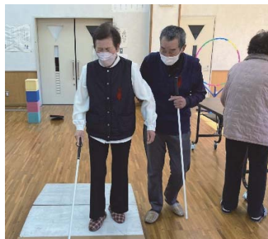
福祉体験 白杖歩行