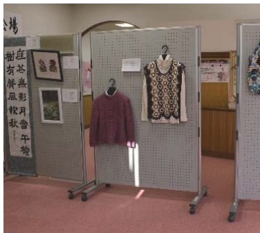
老人クラブ作品展 part2