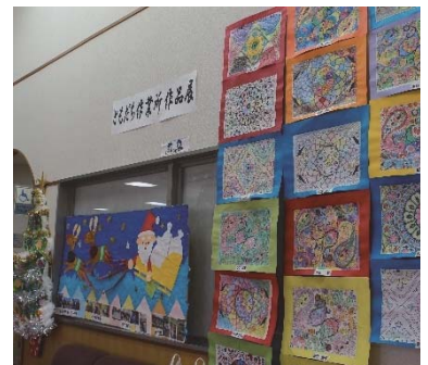
ともだち作業所作品展