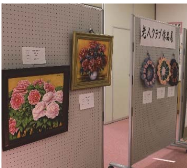
老人クラブ作品展 part1