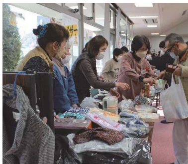
民生委員協議会バザー