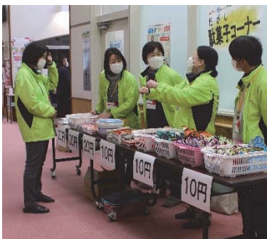
超特価 駄菓子コーナー