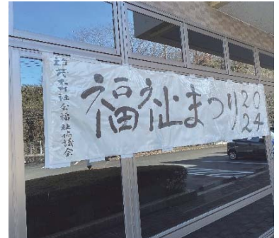
迫力満点の大横断幕