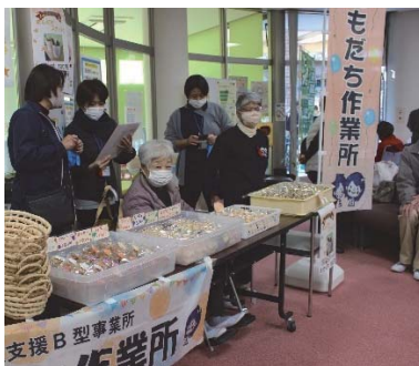
ともたち作業所の焼き菓子