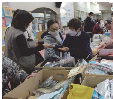
手作りボランティアバザー