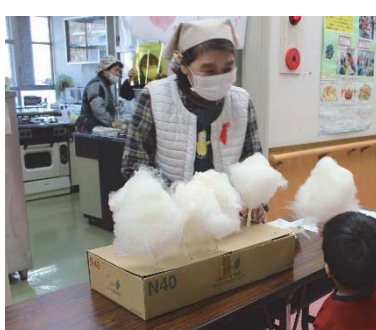
婦人ボランティアのわたあめ