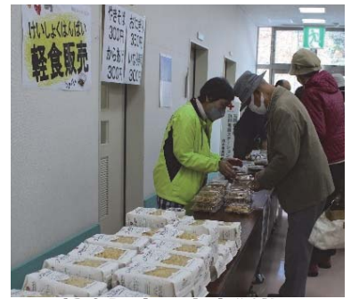
軽食販売 完売御礼

おかげさまで多くの来場者にお楽しみいただき、コロナ禍で切れかけていた地域の方々との糸を改めて紡ぐことができた福祉まつりとなりました