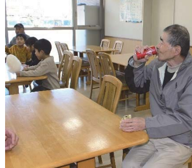
食堂でホッと一息