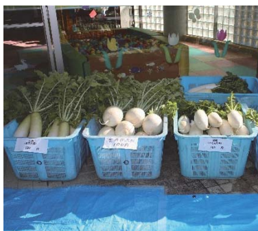
目玉商品の朝採れ大根