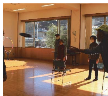
遊び体験 アクセラシー