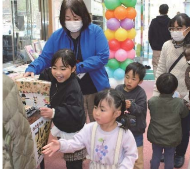
お楽しみクジで景品獲得