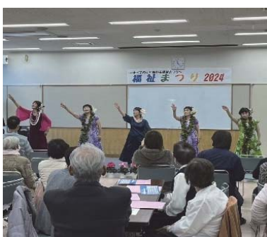
真冬の熱いフラステージ