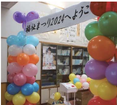
バルーン柱のゲートが歓迎