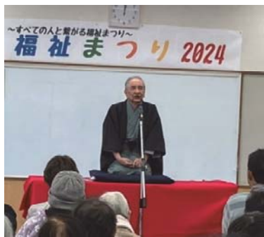
エンディングでは落語を披露