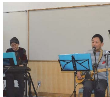
生バンド演奏ステージ