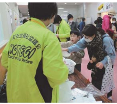
賑わう駄菓子コーナー