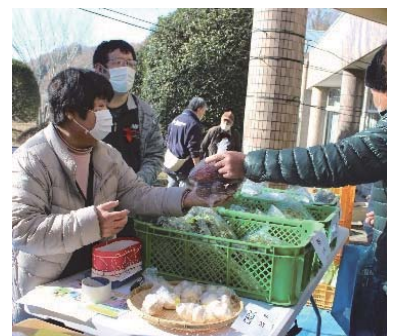
野菜コーナー大盛況