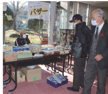
ゲートボール協会バザー